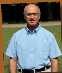
Le mot du Président de la Commission

Votre fédération vous présente son catalogue des formations pour cette nouvelle année. Chaque saison de chasse nous rappelle l'importance de la vigilance, du respect des règles et de la sécurité pour tous. Parce que la chasse est un loisir partagé, elle doit rester exemplaire dans tous les domaines.